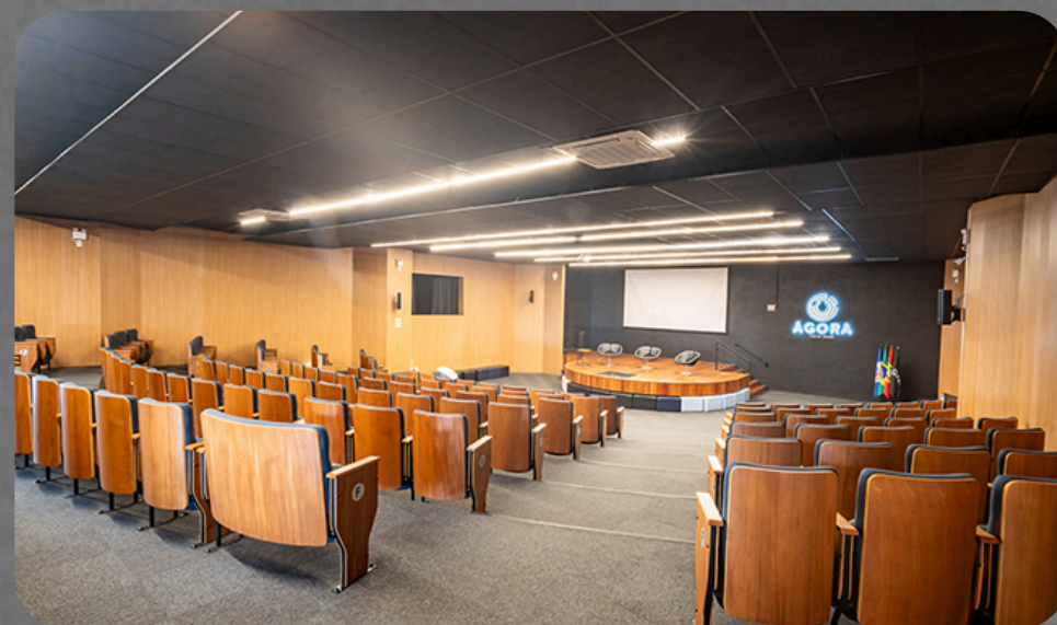
Auditório – HUB (palestras)