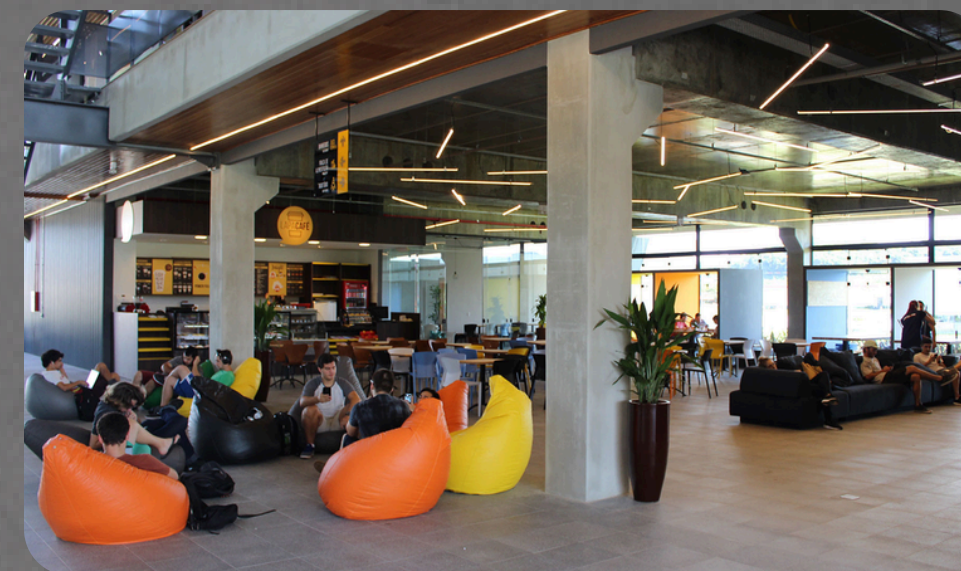
Happy Hour – Confraria Industrial