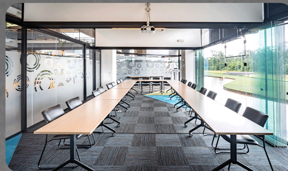
Sala de Treinamento – HUB (Trilhas)