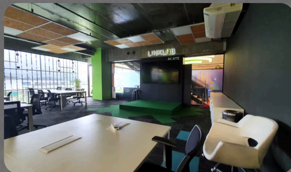
LinkLab ACATE – HUB