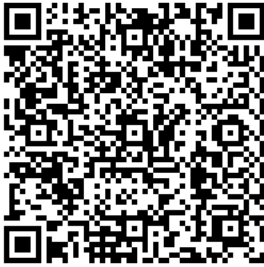
ESCANEE O QR CODE P/ PAGAR!

00020101021226770014BR.GOV.BCB.PIX2555api.itaupix/qr/v2/ee052912-4196-4f64-a398-185fafcbab445204000053039865802BR5916PAGHIPER IP LTDA6009PARANAVAI62070503***63040969