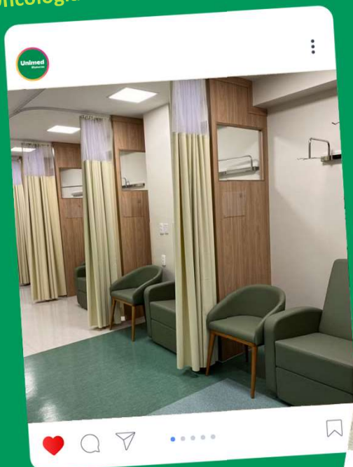
Centro de Oncologia